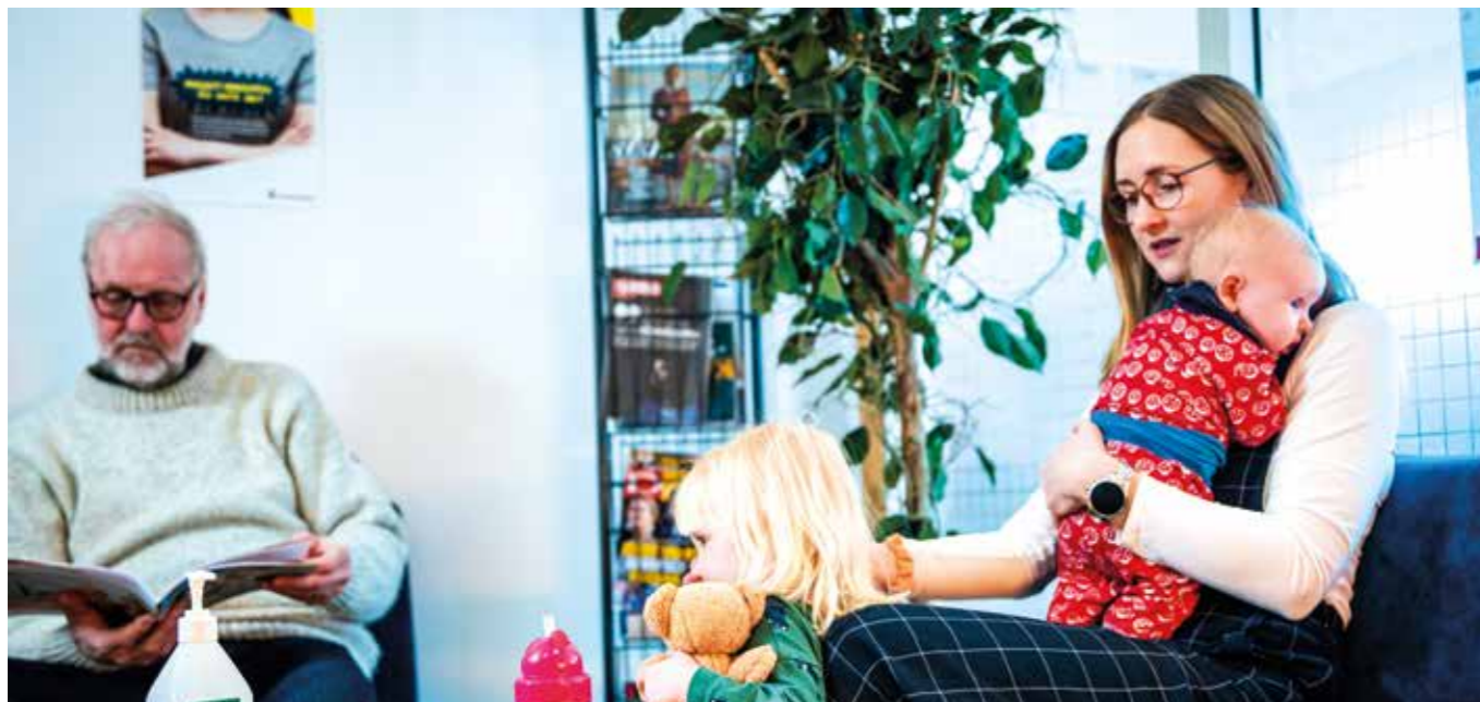
Ingen ska tvingas välja mellan mat och att ta sin medicin. Men vi ser hur borgerlig politiker gör medicin och vårdbesöken dyrare. Vi vill istället ha en vård som ges efter behov, inte efter plånbok!

Nu höjer den borgerliga majoriteten, med stöd av Sverigedemokraterna, avgifterna för både vårdbesök och mediciner. Det innebär att ännu fler människor tvingas välja mellan att betala hyran eller ta sin livsnödvändiga medicin.