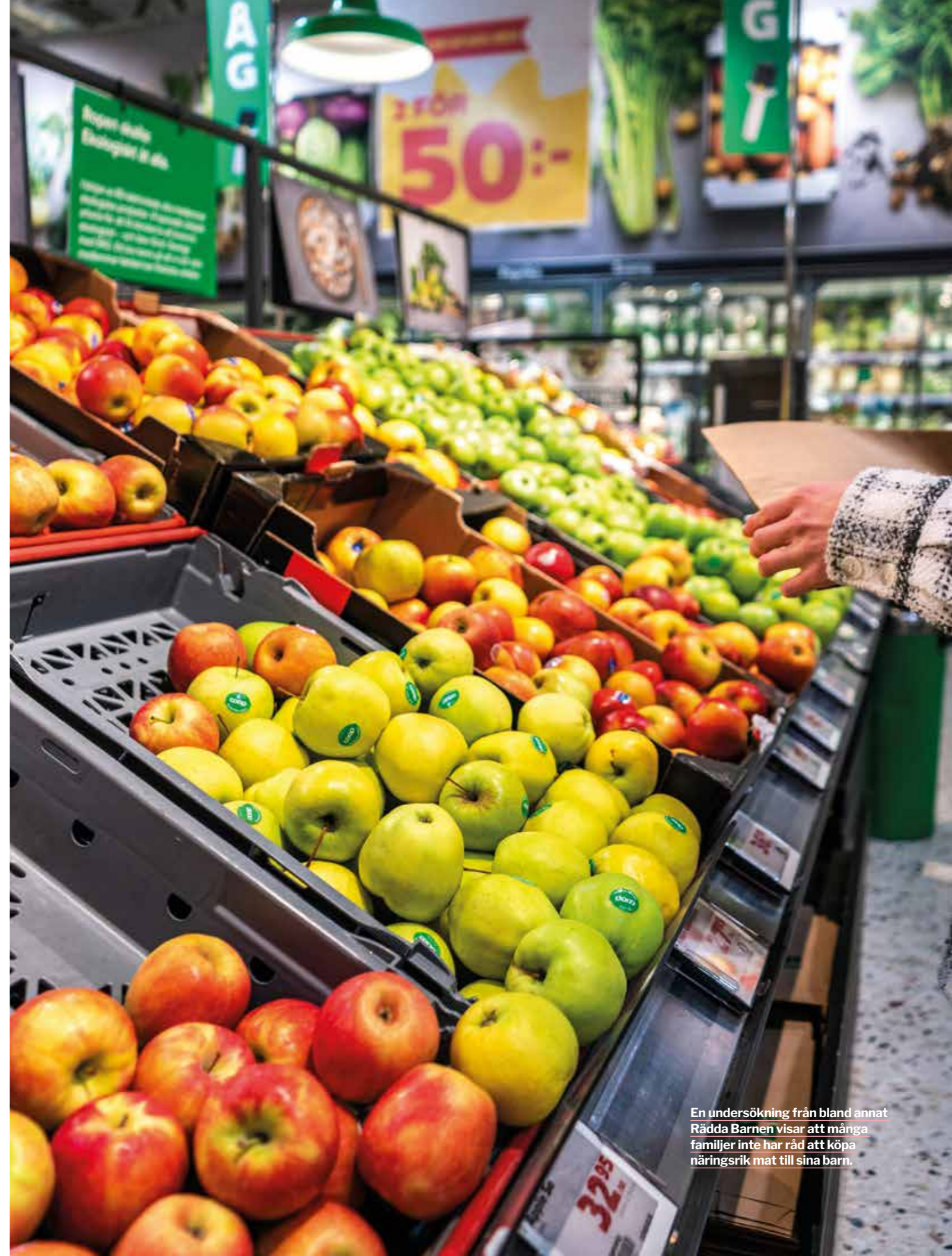
En undersökning från bland annat Rädda Barnen visar att många familjer inte har råd att köpa näringsrik mat till sina barn.