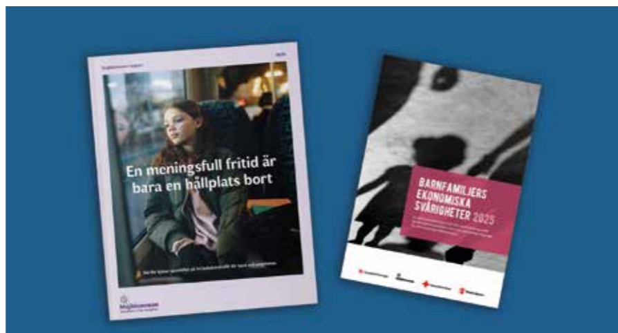
Majblommans rapport En meningsfull fritid är bara en hållplats bort kom i januari 2025, och rapporten Barnfamiljers ekonomiska svårigheter från Hyresgästföreningen, Majblomman, Röda Korset och Rädda Barnen i mars 2025.

I rapporten från Skånetrafiken för december 2024 framgår det att Skånetrafiken har sett en ökad försäljning av sommarbiljetter efter att priset sänkts. Under 2024 såldes över 251 000 sommarbiljetter, vilket är en ökning med 20% jämfört med tidigare år. Det visar att priset på biljetter har en stor inverkan på resandet, och att sänkta priser kan leda till en ökad användning av kollektivtrafik. Om Skånetrafiken fortsätter att sänka priset på sommarbiljetten även nästa