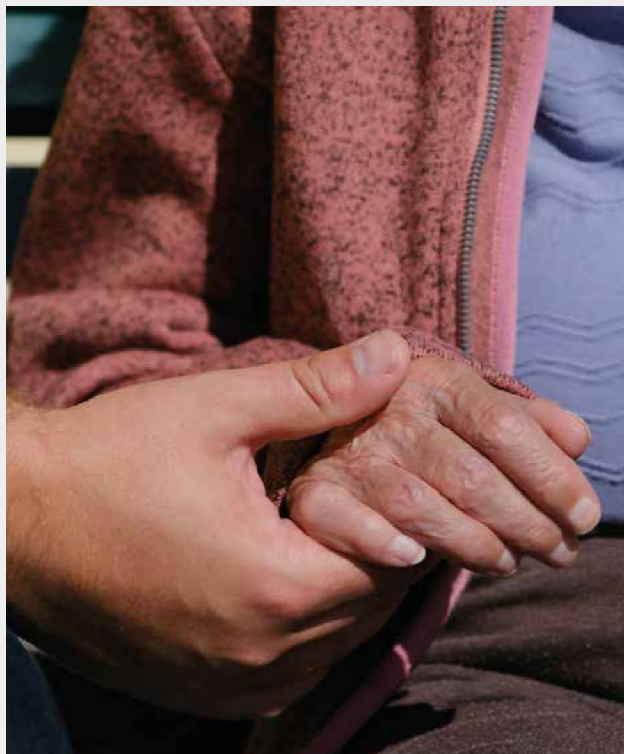
I Malmö pastorats kyrkor möts människor för att bygga broar, inte murar.

ner är aktiva i hjälparbete och brobyggande, så pågår det också utbildning som arrangeras av Malmö pastorat, i att utbilda personer från andra religioner för att hjälpa fler.