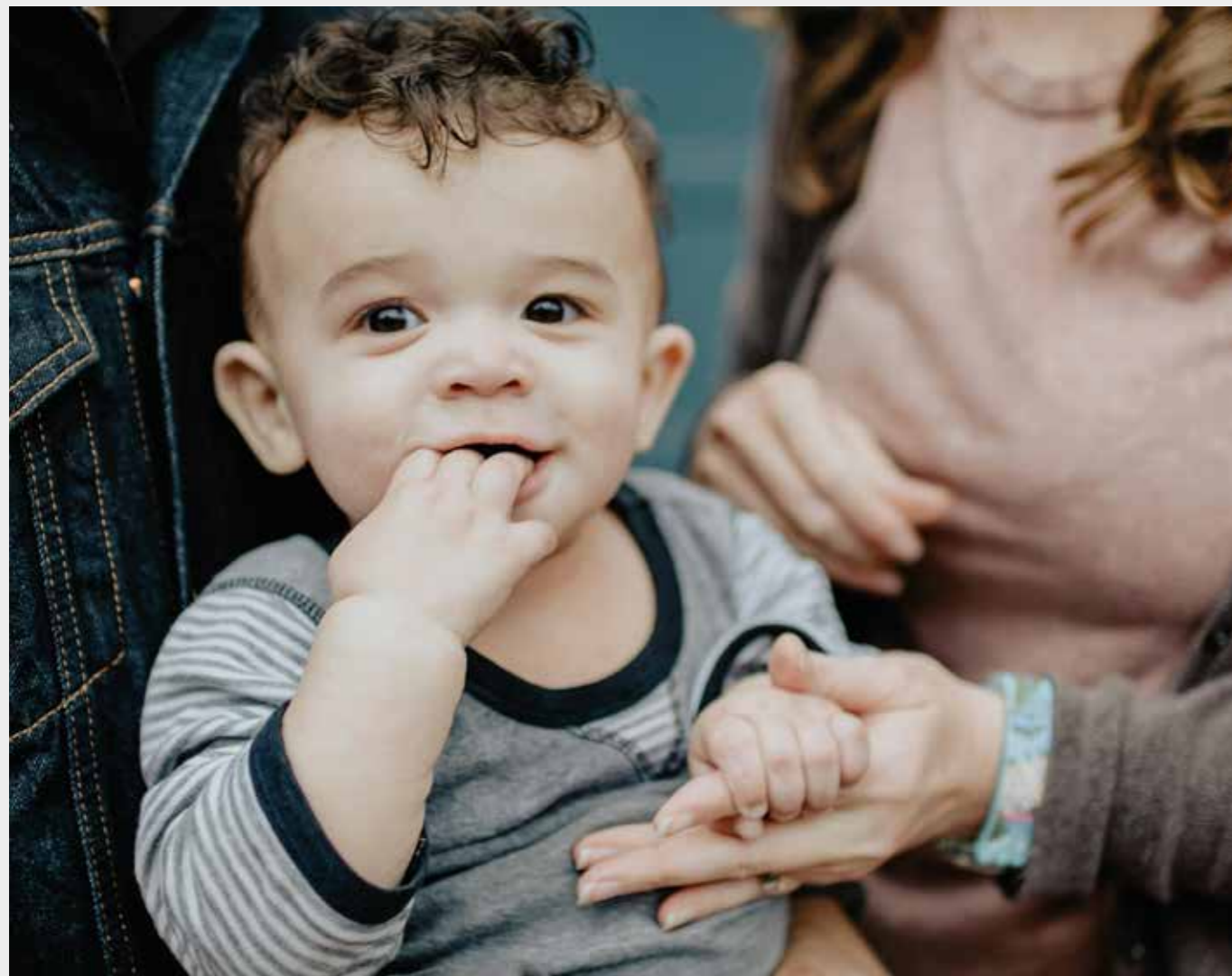
61 barnfamiljer kördes ut från sina hem under 2024 i Malmö och mörkertalet är stort. Vänsterpartiet vill att kommunen beslutar om en nolltolerans mot vräkningar av barn.