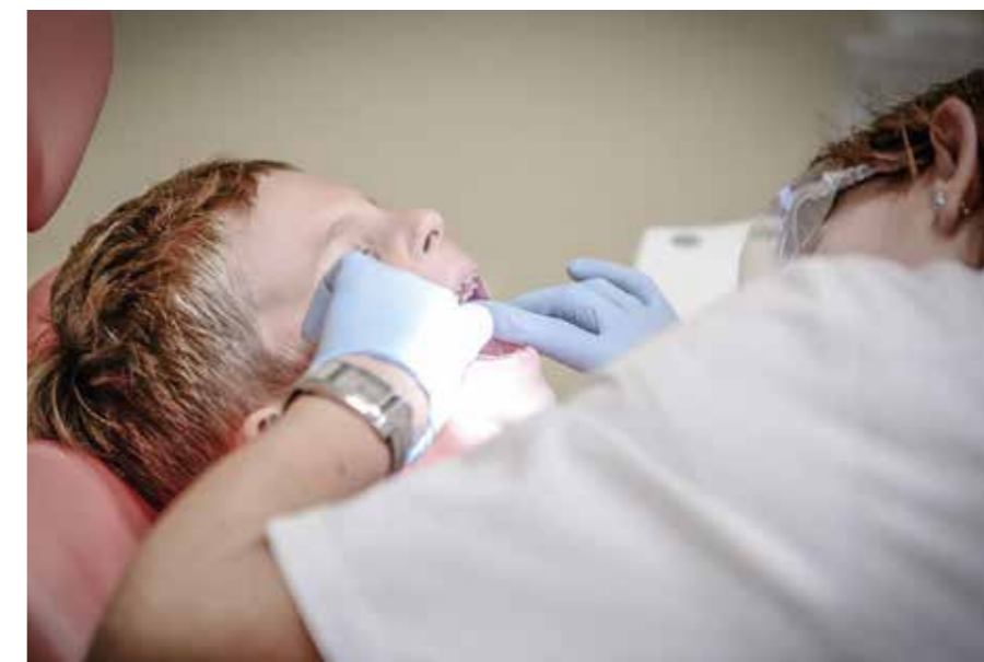
Ingen ska tvingas välja mellan mat och att ta sin medicin. Men vi ser hur borgerliga politiker gör medicin och vårdbesöken dyrare. Vi vill istället ha en vård som ges efter behov, inte efter plånbok.

Regeringen gör nu saken ännu värre. I stället för att stärka barns och ungas tillgång till tandvård föreslår man att