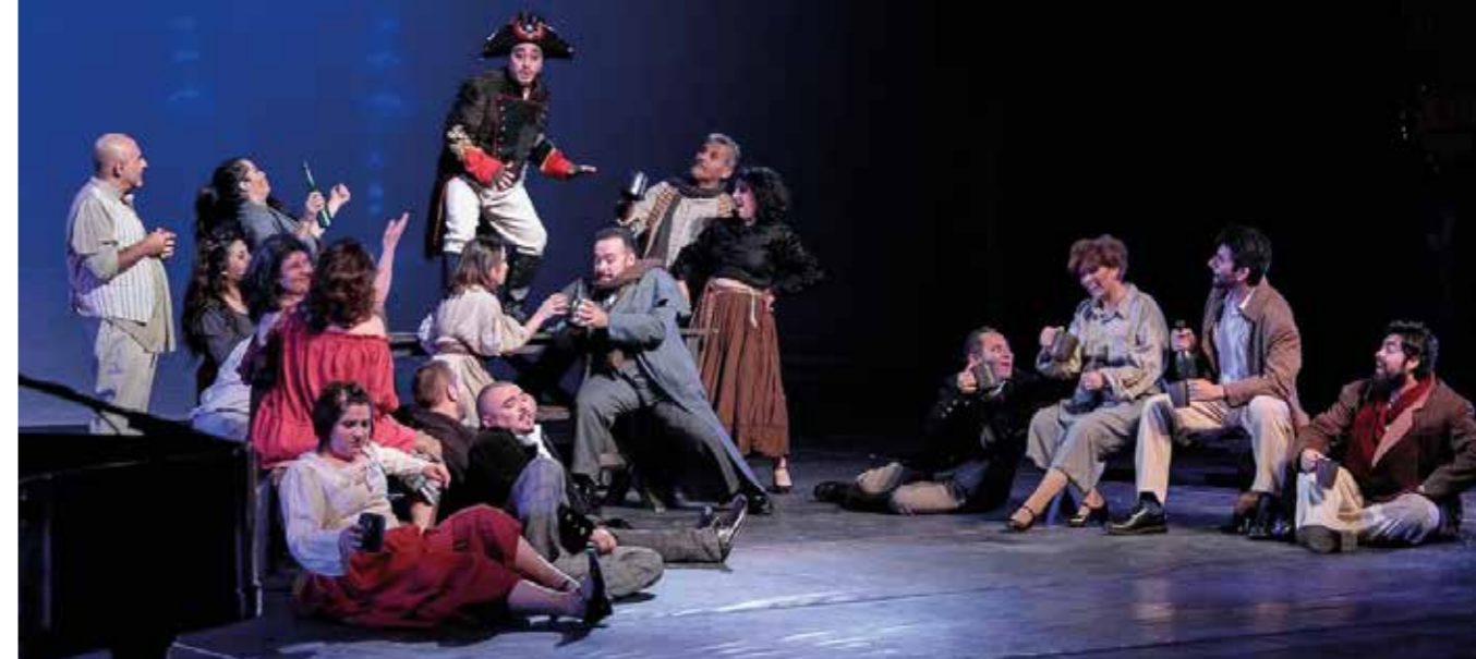
Alla ska ha råd med kultur! Kultur precis som kollektivtrafik och sjukvård måste få kosta skattepengar och ta plats, om vi menar allvar med att den ska finnas för alla, oberoende av var en bor eller hur stort bankkonto en har. Annars blir den bara något för de välbemedlade, samtidigt som bara de kulturaktörer som lockar sponsorer kommer kunna överleva.

I synen på kulturen står ideologierna emot varandra. I den nyliberala ideologin är kulturen en vara som vi kan ha eller mista, en vara som ska lyda under marknadens villkor, vilket återspeglades i det tal Parisa Liljestrand höll vid invigningen av Göteborgs Filmfestival: en uppläxning av landets filmskapare, men inte ett ord om filmkonsten eller om några som helst visioner.