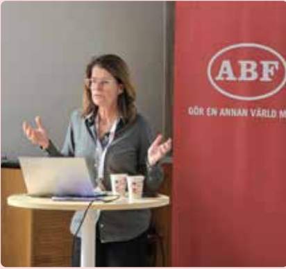
Carina Örgård, regionråd, Västra Götaland