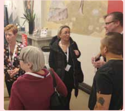
Frågor om kortare arbetsdag tillsammans med representanter för Kommunal