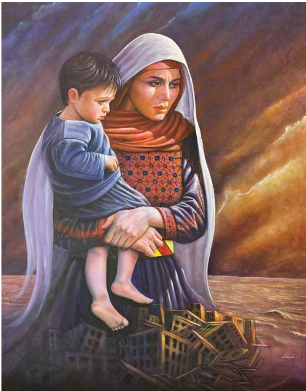
KONSTNÄR: MAMOUN AL SHAYEB

Begränsad eftersändning. Vid definitiv eftersändning återsänds försändelsen med nya adressen.