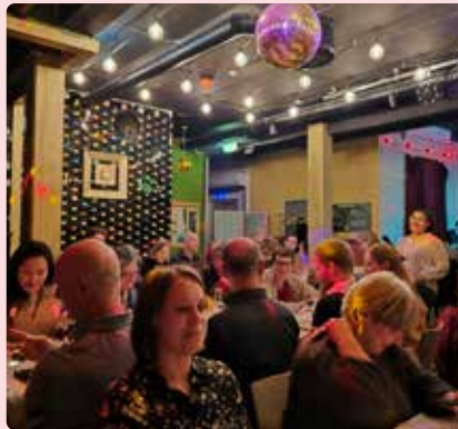
Middag med intressanta samtal och reflektioner