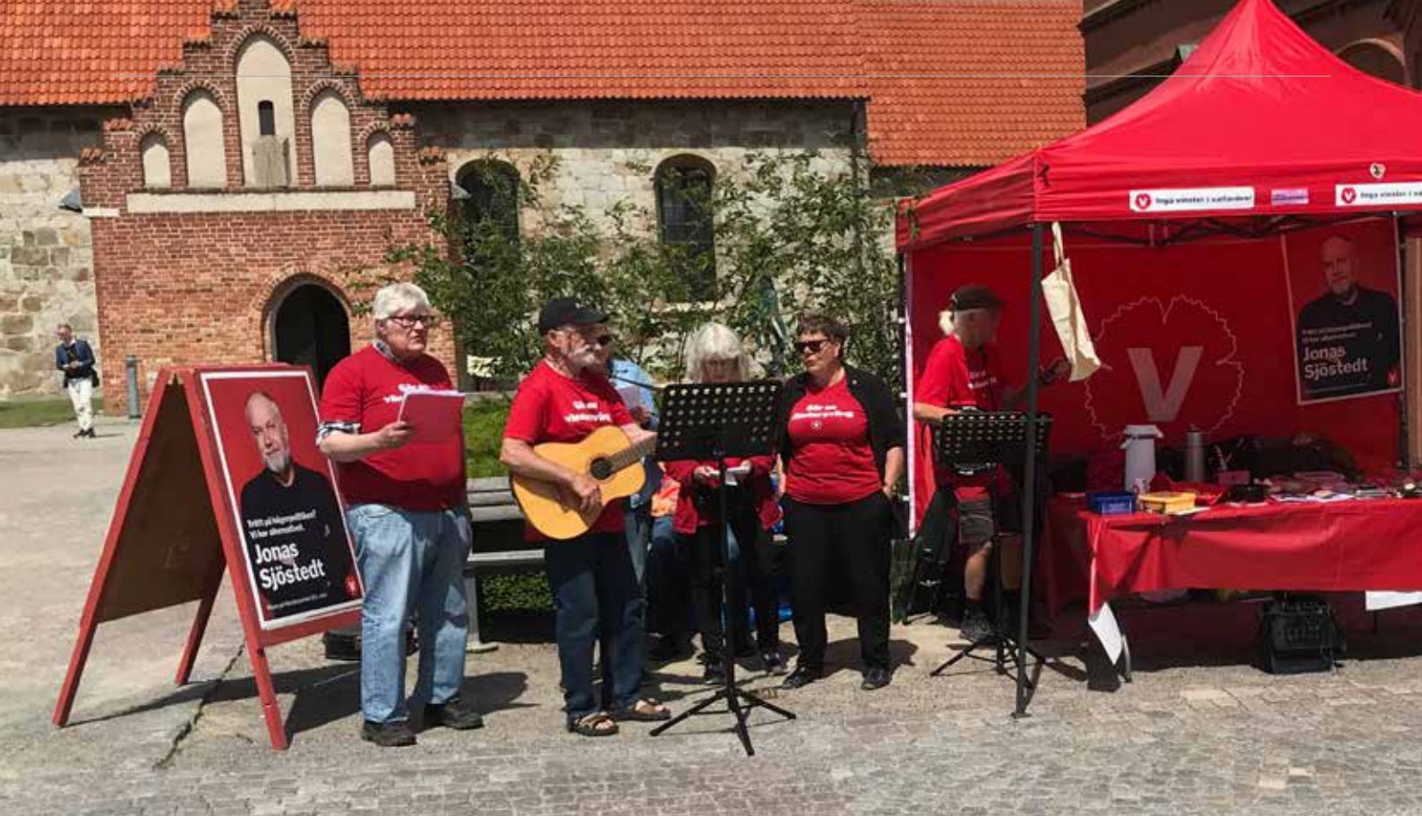
Sånggruppen Vänstersväng i Simrishamn vid ett tidigare tillfälle.