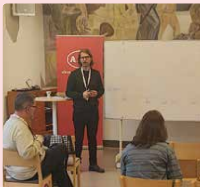
Strategisk diskussion med regiongruppen