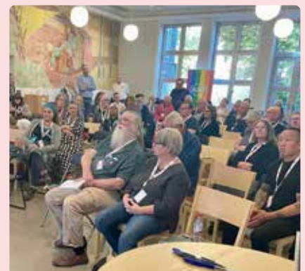
Tack alla som kom och gjorde Skånes Vänsterdagar till väldigt intressanta dagar