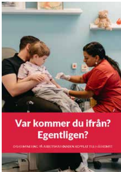
Kommunals rapport visar att negativa attityder mot utlandsfödda har ökat under de senaste tre åren.

– Ja det förekommer att Kommunals medlemmar utsätts för rasism, våld och diskriminering.