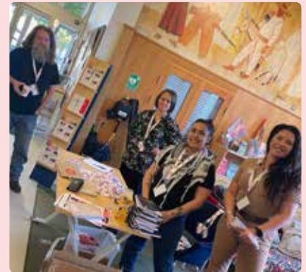
Många behöves för att genomföra dagen